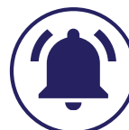
Sistema de respuesta de emergencia personal (PERS)

La elección del participante se aplica a todos los programas, proveedores y servicios.