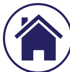
Asistencia de transición en centro de enfermería