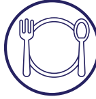
Comidas a domicilio