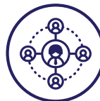
Coordinación de apoyos