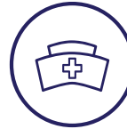
Servicios de enfermería