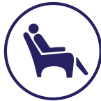
Cuidado de relevo