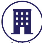
Cuidado diurno para adultos