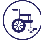
Equipos y suministros médicos especializados