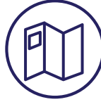
Recursos para cuidadores