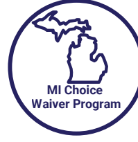
MI Choice Waiver Program

خدمة مصممة لتحديد وتعبئة وإدارة مجموعة متنوعة من خدمات الرعاية المنزلية وغيرها من الخدمات التي يحتاجها كبار السن الضعفاء الذين تبلغ أعمارهم 60 عامًا أو أكثر المعرضين لخطر كبير من وضعهم في دور رعاية سابقة لأوانها