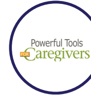
Powerful Tools Caregivers