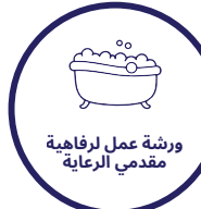
ورشة عمل لرفاهية مقدمي الرعاية