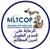
MLTCOP MICHIGAN LONG TERM CARE OMBUDSMAN PROGRAM الرعاية على المدى الطويل أمين المظالم