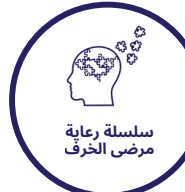
سلسلة رعاية مرضى الخرف