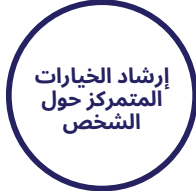
إرشاد الخبراء حول الشخص